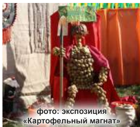
фото: экспозиция «Картофельный магнат»