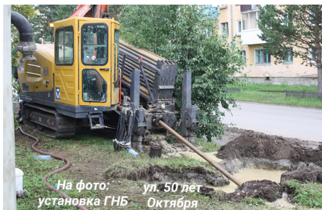
На фото: установка ГНБ ул. 50 лет Октября

В Сорске полным ходом идут работы по национальному проекту «Инфраструктура для жизни». Особое внимание уделяется капитальному ремонту систем холодного водоснабжения на улицах Кирова и 50 лет Октября. Интересно, что на этих участках работают разные подрядчики, применяющие совершенно различные методы. Два подхода — одна цель.