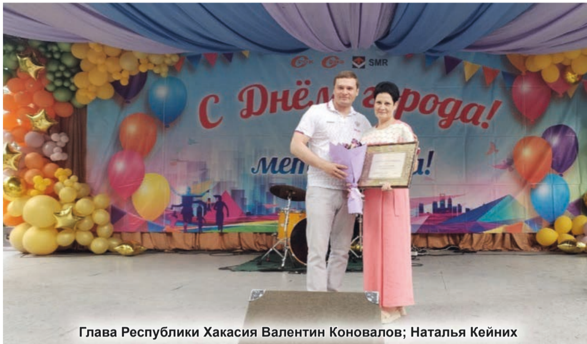
Глава Республики Хакасия Валентин Коновалов; Наталья Кейних

День металлурга традиционно празднуется летом, однако в этот день мы отмечаем ещё одно очень значимое событие для каждого жителя Сорска – День города.