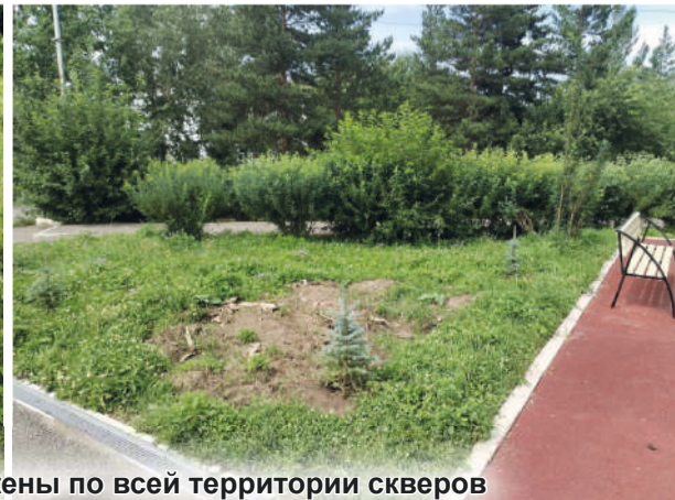
Новые хвойные деревья высажены по всей территории скверов